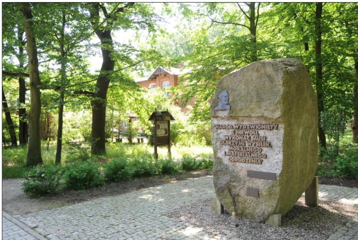
Ryc. 6. Kamień Ignacego Mościckiego w Spale