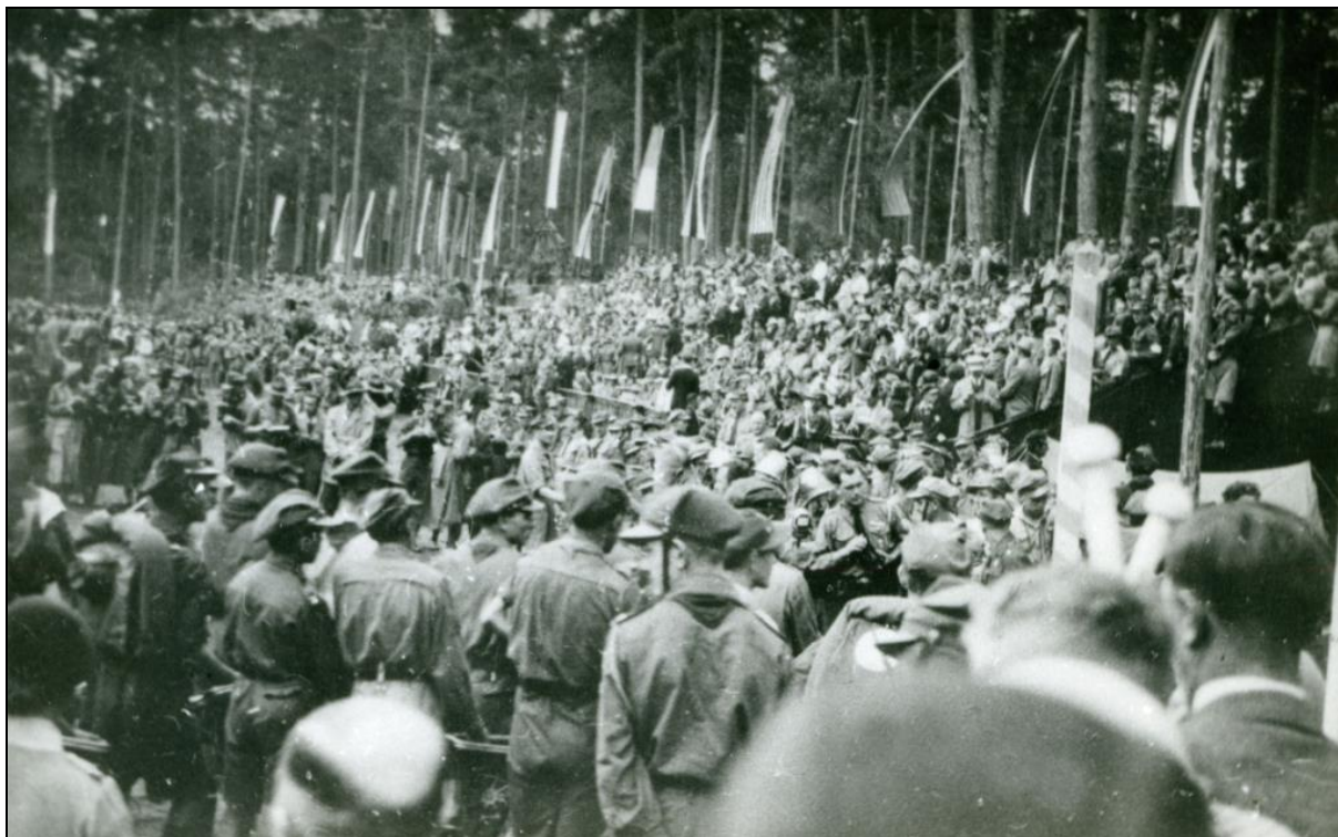
Ryc. 5. Zlot ZHP w Spale w 1935 roku