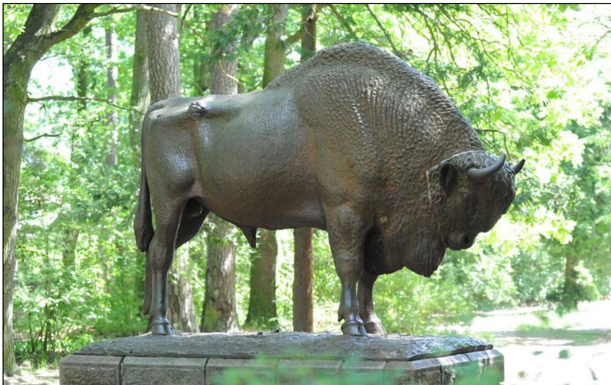
Ryc. 9. Posąg żeliwnego żubra w Spale

Środowisko lokalne dąży obecnie do odbudowy spalonego w 1945 r. pałacyku myśliwskiego, który w przeszłości stanowił swoisty symbol carskiej i prezydenckiej Spały. Największym planowanym przedsięwzięciem jest stworzenie w najbliższych latach Spalskiego Parku Kulturowego, który powinien stać się prawdziwym kołem zamachowym rozwoju turystyki regionalnej i lokalnej przede wszystkim o wymiarze kulturowym.