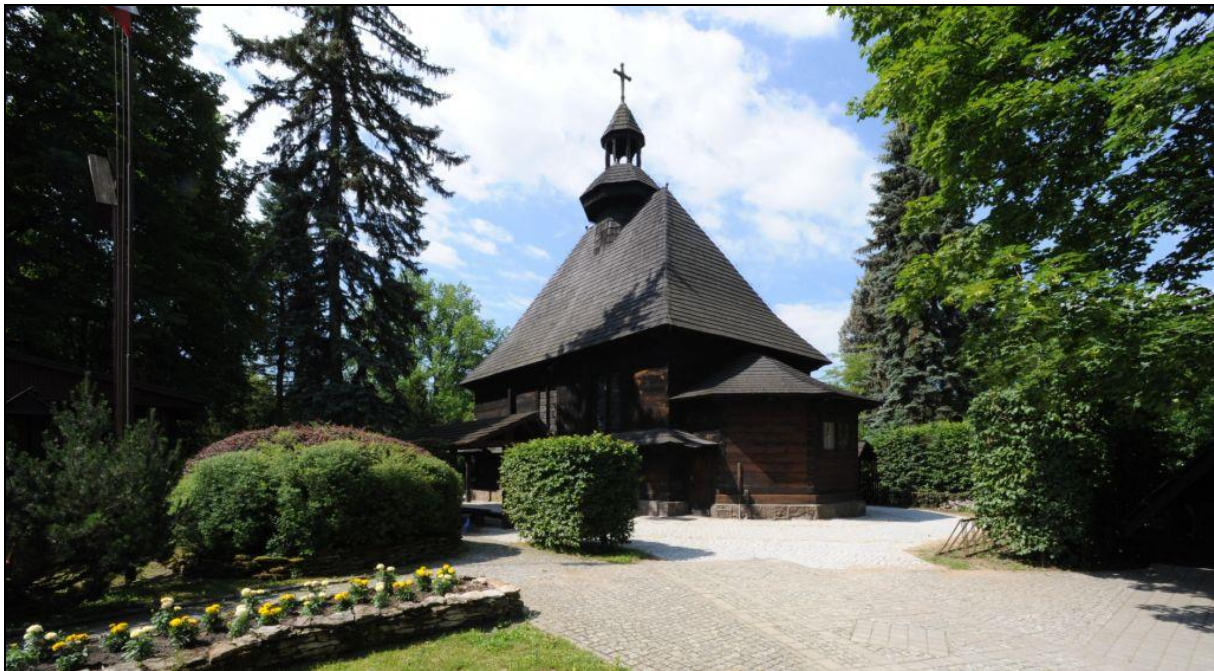
Ryc. 3. Kaplica prezydencka w Spale (stan obecny)

wojskowych generał Władysław Sikorski. Wówczas pałac myśliwski poddano niezbędnym remontom, wyburzono też częściowo budynki koszar kozackich i uporządkowano park.