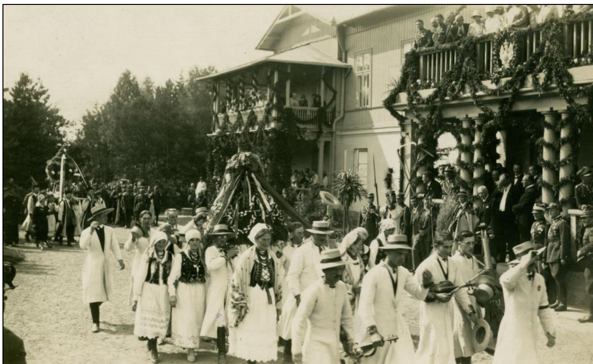
Ryc. 4. Dożynki Prezydenckie w Spale (rok 1928)