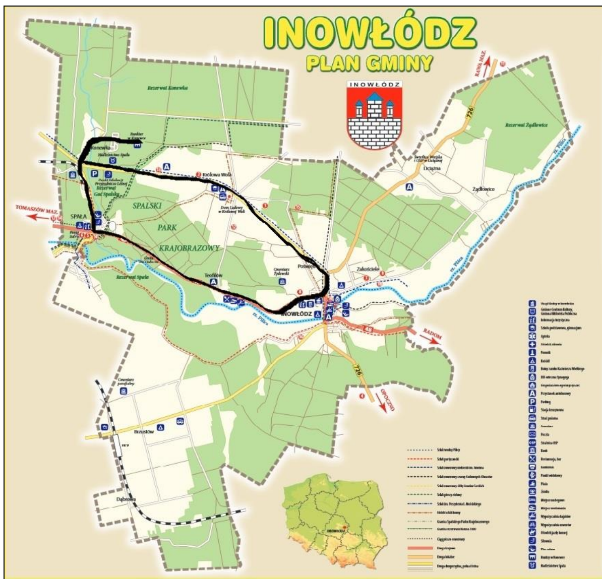
Ryc. 8. Schematyczny plan gminy Inowłódz z zaznaczoną planowaną trasą pieszo-rowerową Źródło: Opracowanie własne na planie z Informatora gminy Inowłódz (2014).

której początki sięgają wczesnego średniowiecza. Wśród wielu interesujących i historycznie cennych zabytków można wymienić m.in.: romański kościół pod wezwaniem św. Idziego ufundowany w 1086 r. przez Władysława Hermana, zrekonstruowany w ostatnich latach Zamek Kazimierza Wielkiego z XIV wieku, kościół parafialny pod wezwaniem św. Michała Archanioła z 1520 r., świetnie zachowaną synagogę z początku XIX wieku. Warto nadmienić, że w Inowłodzu wakacje spędzał młody Julian Tuwim, który opisy jego pięknej przyrody zawarł w Kwiatach Polskich .