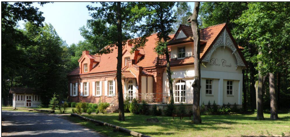
Ryc. 7. Dawna kuchnia carska, obecnie pensjonat Dwór Carski